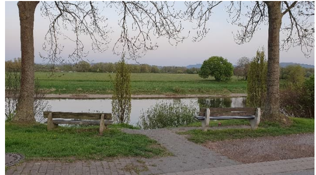
Abbildung 6: Aussichtspunkt mit Ausblick