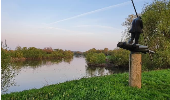
Abbildung 3: Flößerdenkmal und Ausblick