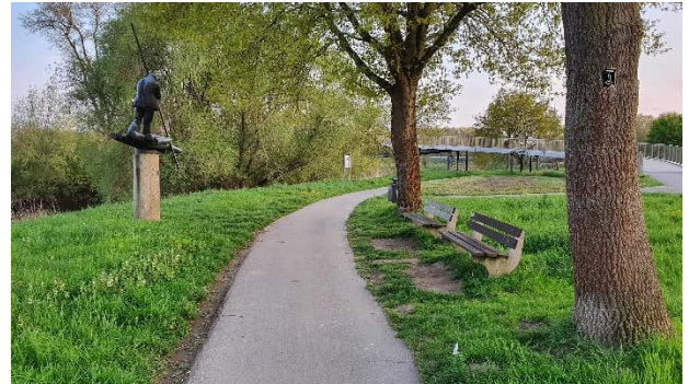
Abbildung 4: Flößerdenkmal und Sitzmöglichkeiten