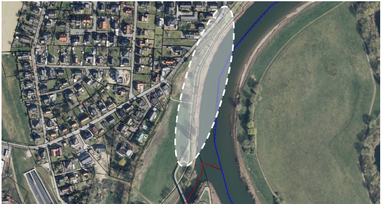
Abbildung 1: Standortvorschlag