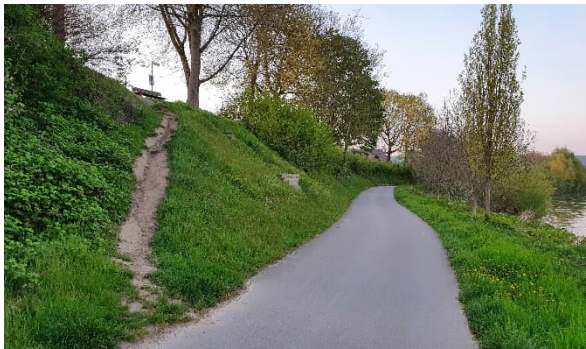
Abbildung 5: Zugang zum Aussichtspunkt