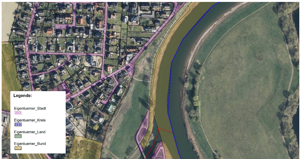
Abbildung 2: Eigentumsverhältnisse