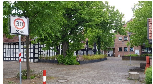
Abbildung 5: Fläche vor dem Harren Hof aus nordöstlicher Richtung betrachtet