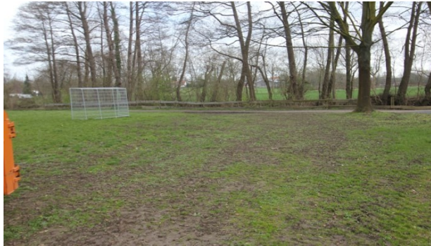
Abbildung 4: Freifläche am Bolzplatz am Kaarbach aus westlicher Richtung betrachtet