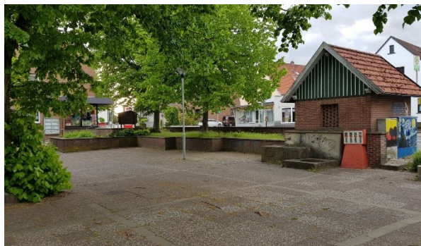
Abbildung 4: Fläche vor dem Harren Hof aus südöstlicher Richtung betrachtet