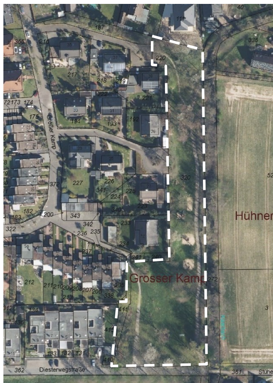
Abbildung 2 Planungsbereich