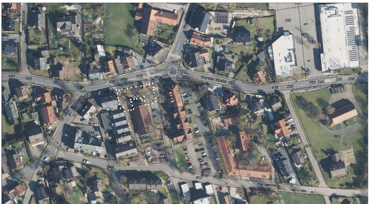
Abbildung 2 Plangebiet