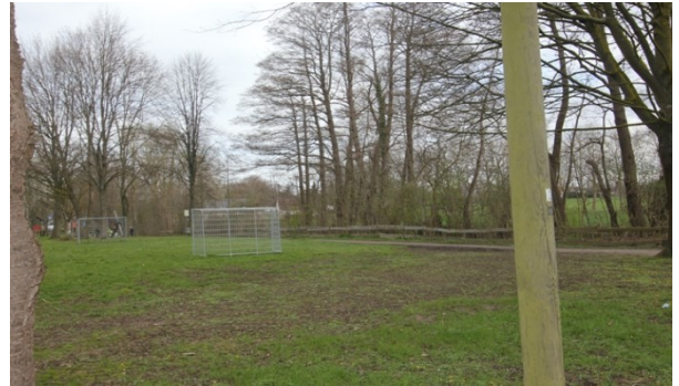
Abbildung 5: Freifläche am Bolzplatz am Kaarbach aus südwestlicher Richtung betrachtet